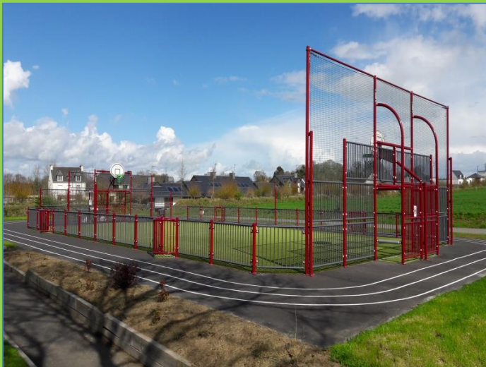
Un mini stadium

Accueillis par le maire Bruno Servel, Rachelle Moisan et des jeunes du conseil municipal des enfants de Kergrist, les enfants ont visité le stadium et un terrain pour les vététistes.