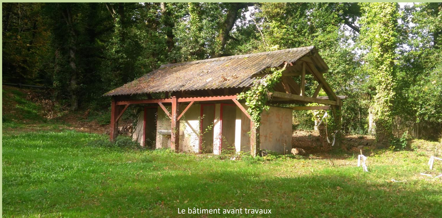
Le bâtiment avant travaux