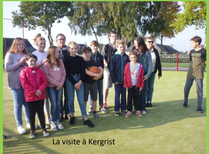
La visite à Kergrist

Des contes à la bibliothèque : Samedi 28 novembre, les amis de la bibliothèque organisaient une après-midi contes. Petits et grands étaient au rendez-vous pour écouter les lectures des conteuses.