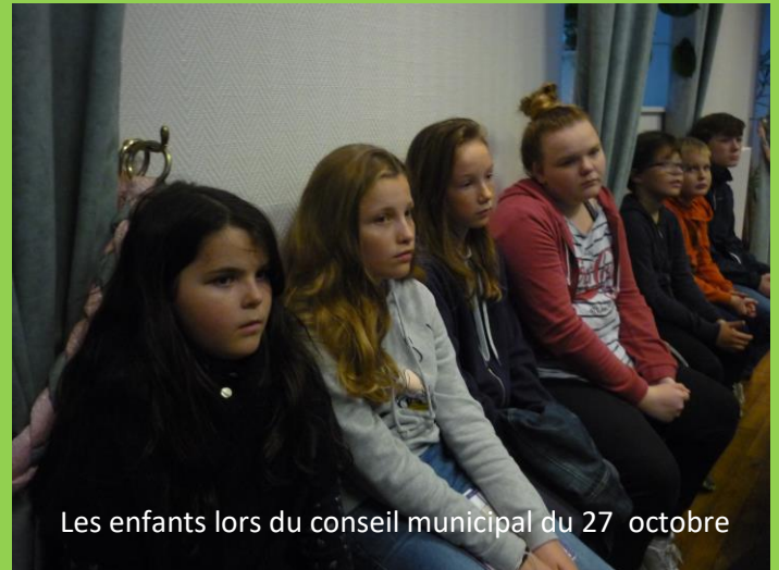
Les enfants lors du conseil municipal du 27 octobre