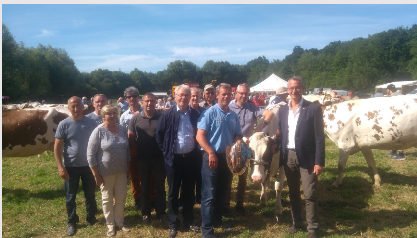
Le GAEC du Quinquis primé en race pie rouge pose avec les élus qui s'étaient déplacés en nombre.

Le comice agricole de l'ancien canton de Cléguérec avait lieu cette année à Saint-Aignan. C'est sous un soleil de plomb que se sont déroulés les concours de bovins et de chevaux. Les associations Saint-Aignannaises étaient en charge de l'organisation du repas et des buvettes. Les bilans financiers ne sont pas encore connus mais ils devraient être excellents au vu du nombre de convives (320 repas le midi) et du succès des buvettes proportionnel à la hauteur du mercure. De nombreuses animations étaient proposées en parallèle, dont celles très remarquées de spectacles équestres avec notamment Pierre Brille de Lann Guilloux qui parle aux chevaux pour les instruire en douceur.