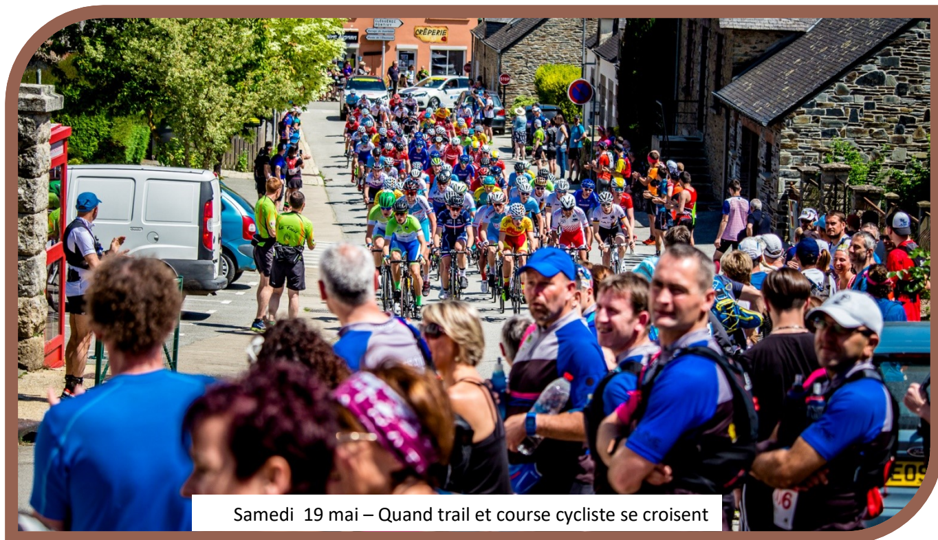
Samedi 19 mai – Quand trail et course cycliste se croisent